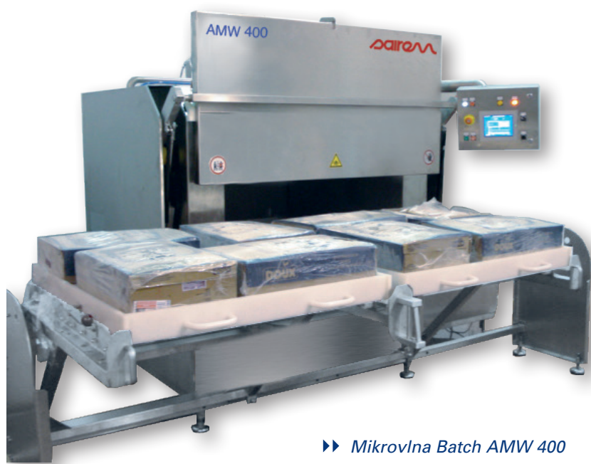
►► Mikrovlna Batch AMW 400

Mikrovlnná zařízení firmy SAIREM typu BATCH umožňují rychlé rozmrazení hluboce zmrazených potravin jako je maso, drůbež, ryby ovoce, zelenina, sýry a mléčné výrobky. Jsou univerzálně použitelné a perfektní všude tam, kde je potřeba rychle a často střídat typ rozmrazovaného materiálu.