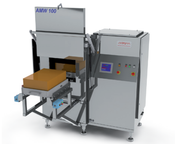
▶▶ SAIREM model AMW 100