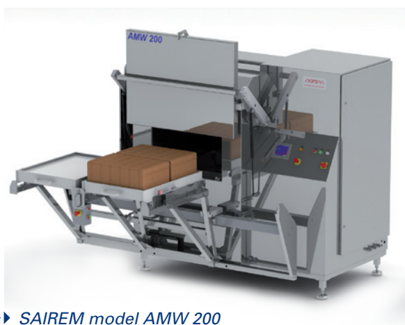
▶▶ SAIREM model AMW 200