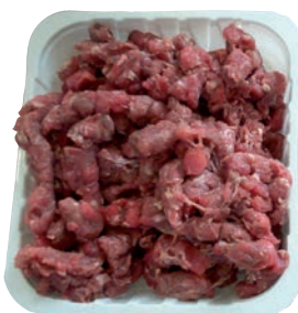
Sekání při -4 °C/-2 °C po mikrovlnném temperování