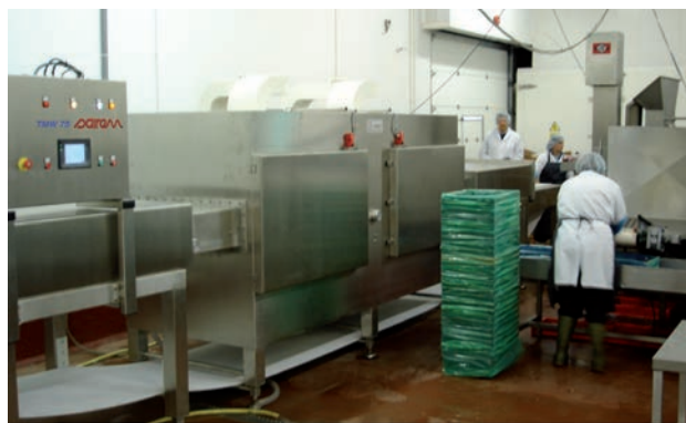
▶▶ SAIREM TMW 75