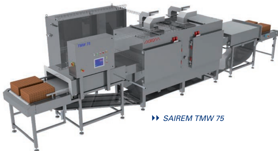
▶▶ SAIREM TMW 75

Mikrovlnná zařízení firmy SAIREM – průběžné linky umožňují rychlé rozmrazení hluboce zmrazených potravin jako je maso, drůbež, ryby ovoce, zelenina, sýry a mléčné výrobky. Jsou univerzálně použitelné a maximálně efektivní pro větší výroby a větší série rozmrazovaného materiálu.