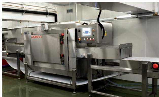
▶▶ SAIREM TMW 35