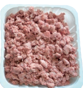
Sekání při -20 °C bez použití mikrovlnného ošetření